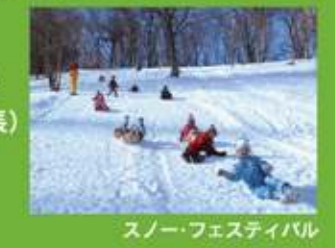
スノー・フェスティバル