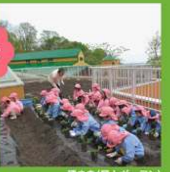
種まき(屋上ガーデン)