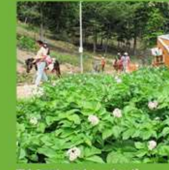
園内ミニホーストレッキング